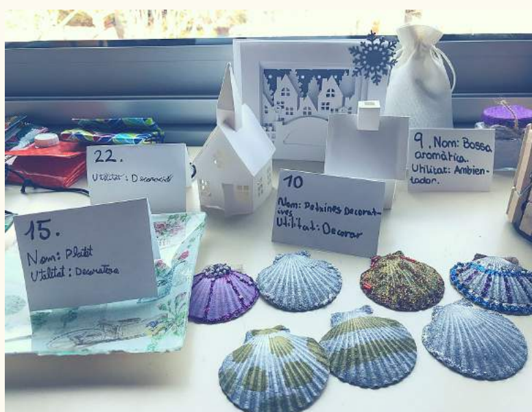
Les dues cooperatives han decidit crear i vendre productes artesans com moneders i objectes decoratius

Una part de la venda dels productes anirà destinada a una ONG i amb l'altra es finançarà una activitat de lleure conjunta.