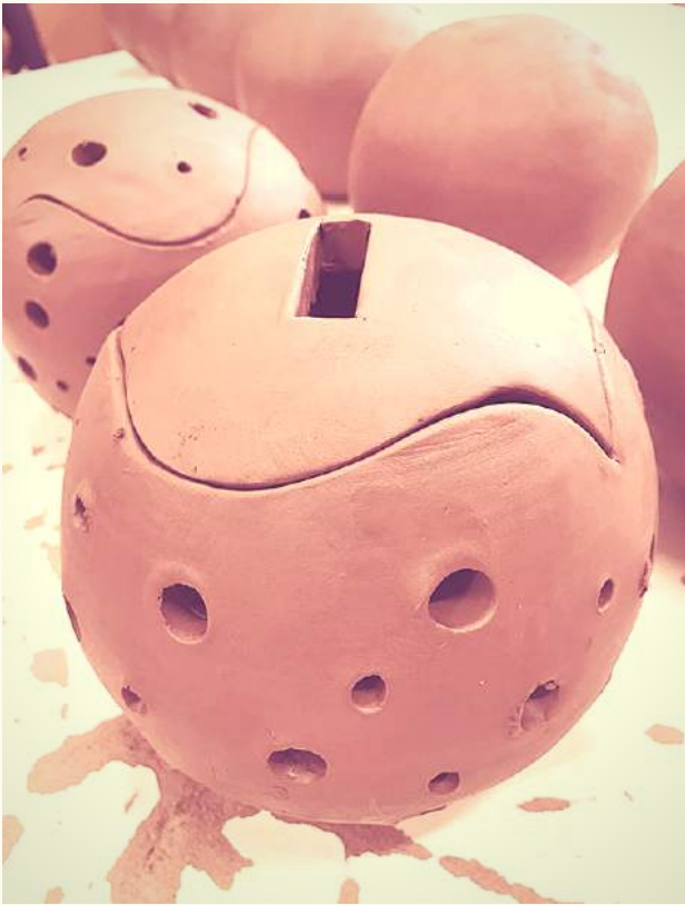
Treballs del taller de ceràmica

A Les Fonts participem, juntament amb la resta d'escoles i l'institut d'Argentona, d'un pla municipal per treballar la ceràmica i les ciències a través de tallers pràctics .